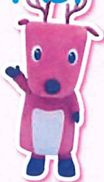
奈良交通 シーカくん