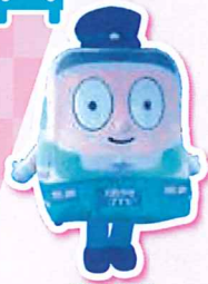
高槻市営バス たかつき ばすお