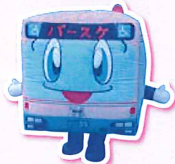
阪急バス バースケ

※都合により登場するキャラクターは変更になる場合がございます。 ※写真はイメージです。